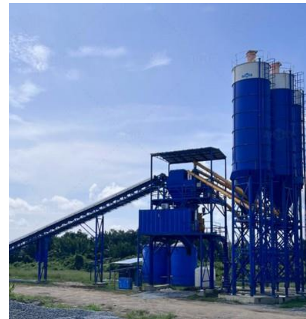
Producción Comercial de Concreto