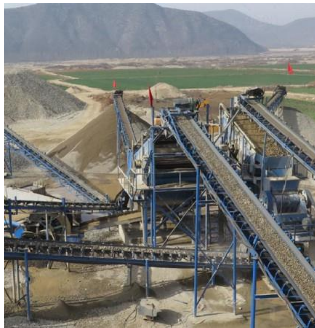
Minería y Agregados