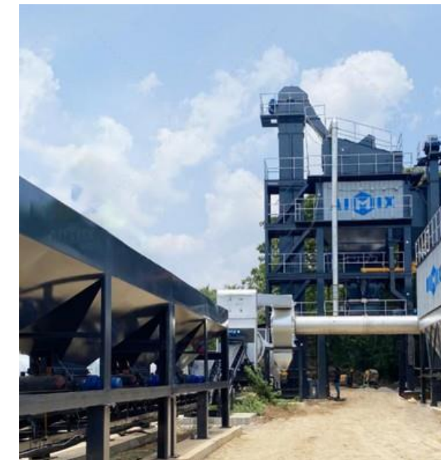
Construcción de Puentes y Carretera