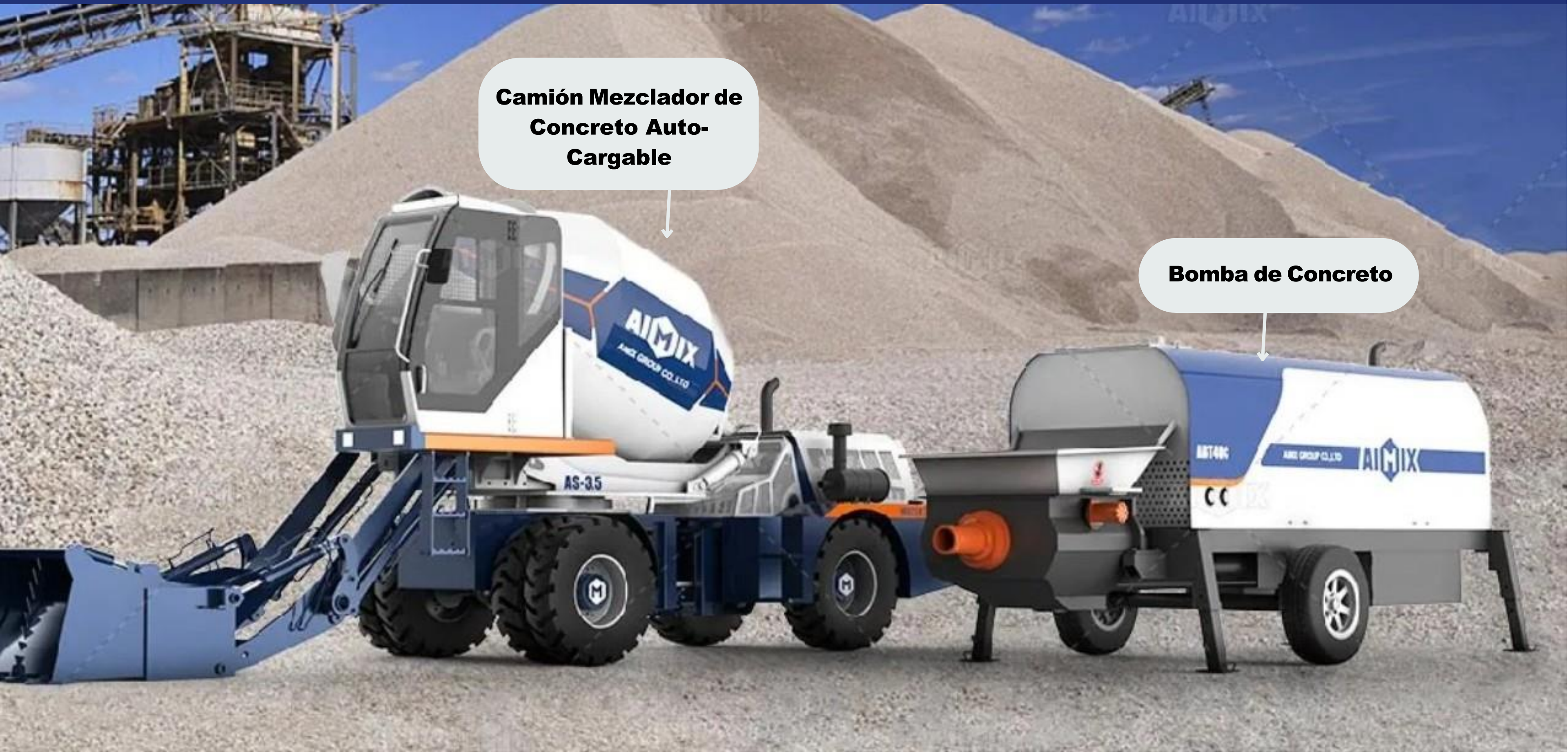
Bomba de Concreto