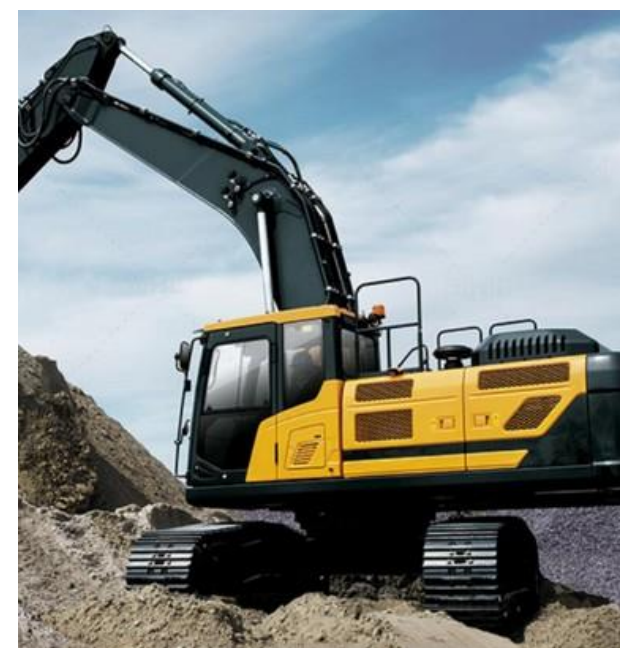
Construcción en Sitio